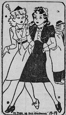
© Prop. de Paul Symphson 17-19 —¿Admiraron sus amigas tu anhelo de compromiso? —Es más: dos de ellas lo reconocieron.

rompí una pierna. ¿Y sabe lo que hizo el caballo? —Usted dirá— dijo cortésmente el compañero. —Pues vino al galope, me alzó con los dientes y me llevó hasta la casa. Como estábamos solos, él mismo me colocó sobre mi cama. Después de ello volvió a salir y galopó como loco durante diez kilómetros en busca de un médico. —¿Y lo trajó?— preguntó el viajero. —Sí... Pero había llamado a un veterinario.